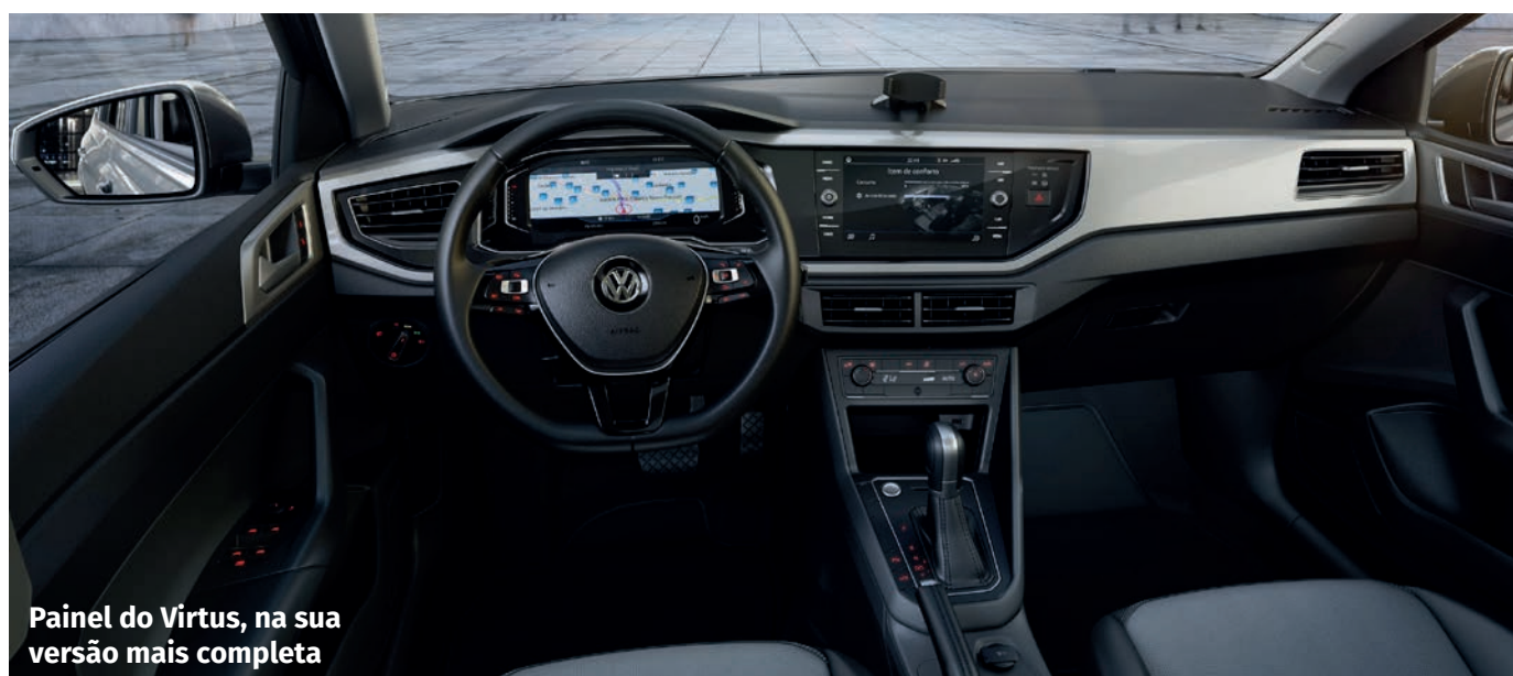
Painel do Virtus, na sua versão mais completa

O modelo Comfortline vem equipado com banco traseiro bipartido, coluna de direção ajustável em altura e distância, Controle Eletrônico de Estabilidade (ESC), faróis de neblina com função “cornering light”, siste-