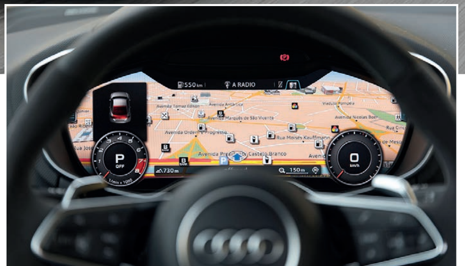
Volante multifuncional e o Audi Virtual cockpit são destaques do interior do TT RS

A potência do motor 2.5 TFSI alcança o asfalto por meio do sistema de tração integral quattro acoplado à transmissão S tronic