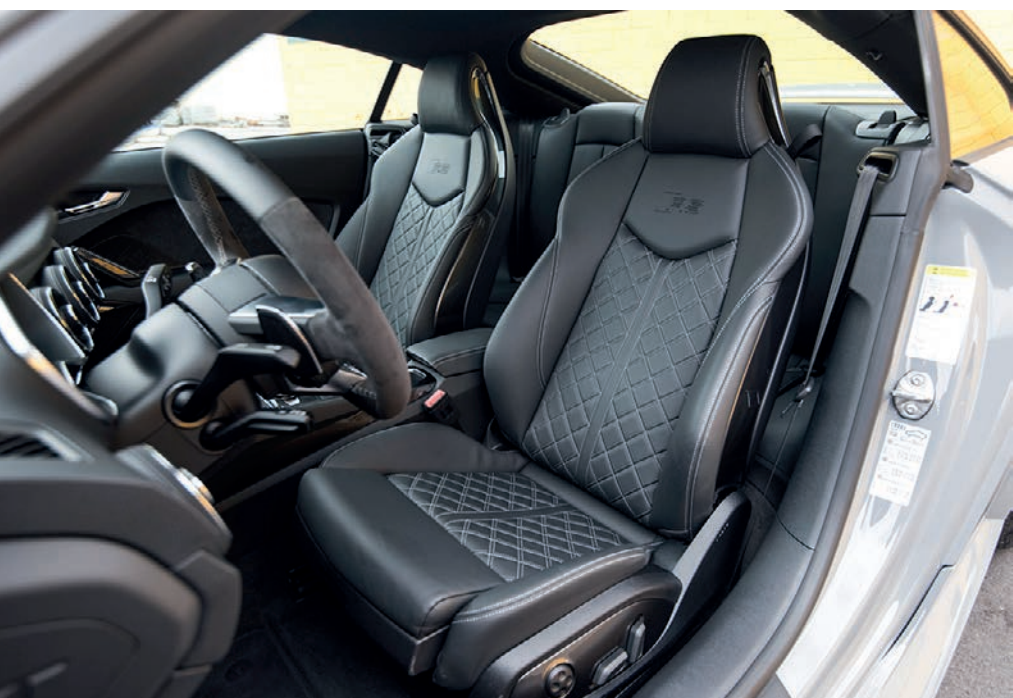
Interior do TT RS conta com bancos em couro Napa Fina e acabamentos em fibra de carbono

A lista de equipamentos inclui Audi virtual cockpit, bancos esportivos de couro Napa Fina, acabamento interno em fibra de carbono, volante multifuncional esportivo com base aplanada revestido em couro, capas dos retrovisores na cor preto brilhante, escapamento esportivo RS, faróis Full Led, lanternas traseiras em OLED, sensor de estacionamento dianteiro e traseiro, além de câmera de ré, Audi drive select, sistema Keyless-Go, suspensão esportiva RS, Audi smartphone interface, sistema de som Bang & Olufsen e rádio MMI com sistema de navegação.