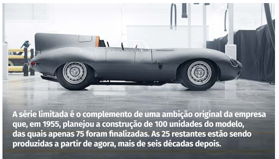
A série limitada é o complemento de uma ambição original da empresa que, em 1955, planejou a construção de 100 unidades do modelo, das quais apenas 75 foram finalizadas. As 25 restantes estão sendo produzidas a partir de agora, mais de seis décadas depois.