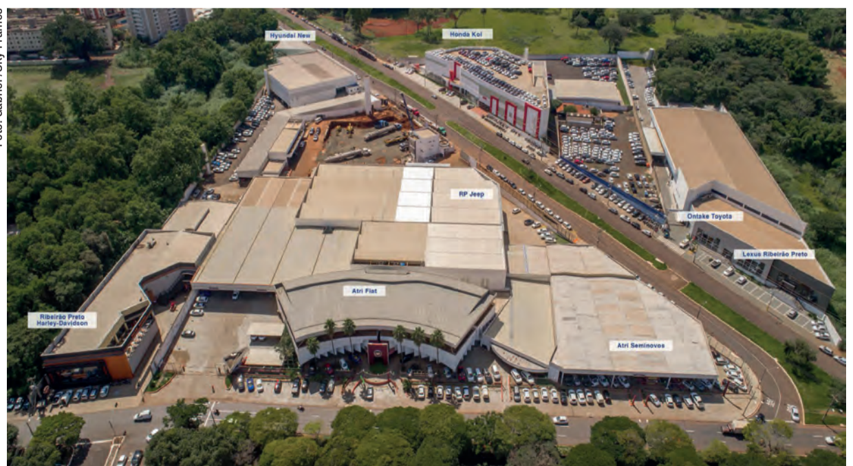
Algumas das 12 marcas do grupo, concentradas nas avenidas Maria de Jesus Condeixa e Francisco Junqueira