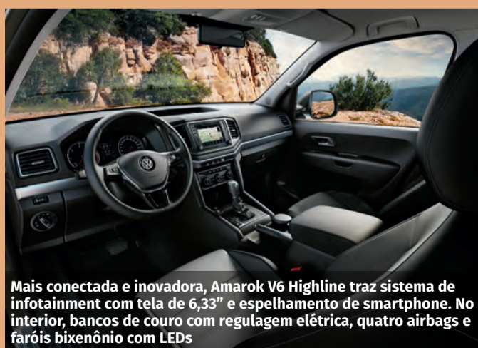
Mais conectada e inovadora, Amarok V6 Highline traz sistema de infotainment com tela de 6,33" e espelhamento de smartphone. No interior, bancos de couro com regulagem elétrica, quatro airbags e faróis bixenônio com LEDs

A central de infotainment "Discover Media" permite a locução de mensagens de texto (SMS) do celular por meio dos alto-falantes. E mais: é possível responder por meio de comando de voz a mensagem, enviada em formato SMS. Fotos, vídeos e músicas em diversos formatos são alguns exemplos de mídias que podem ser "lidas".