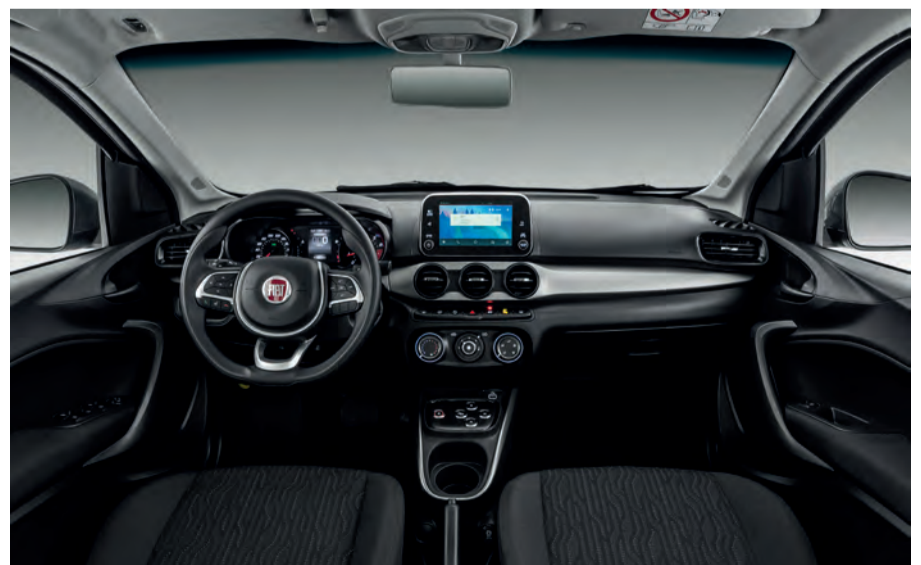
Cabine do Cronos mantém elementos da Jeep. Faixa central do painel é na cor vinho. No Argo, o aplique é o mesmo, mas em tom prateado