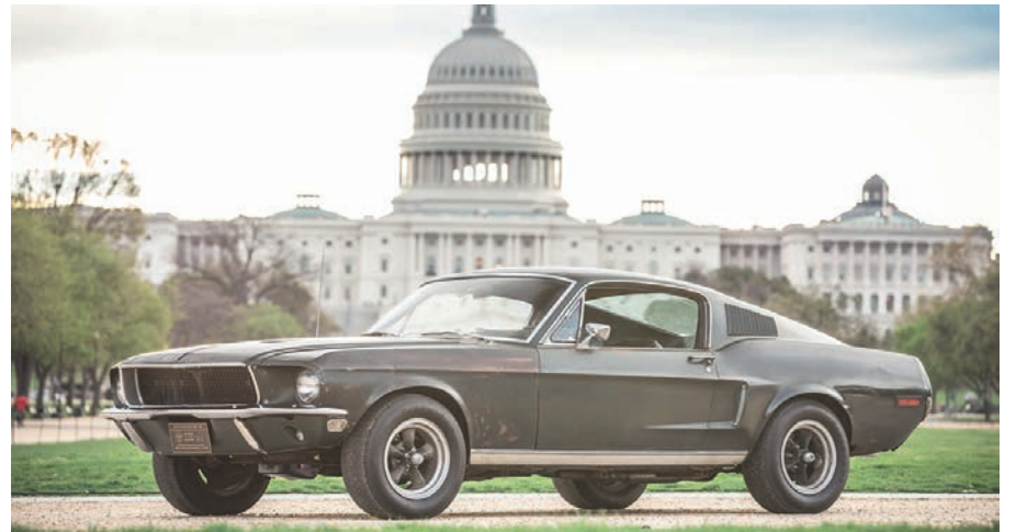
Mustang Bullitt: um dos modelos que viraram ícones no cinema, contribuindo para o seu status de ícone cultura

Hollywood. Seus sucessos na telona incluem três filmes de James Bond: "007 Contra Goldfinger", "007 Contra a Chantagem Atômica" e "007: Os Diamantes São Eternos". Também foi protagonista de duas das mais famosas perseguições do cinema, em "Bullitt" e "60 Segundos". O clássico francês "Um Homem, Uma Mulher" e o suspense "Instinto Selvagem" são outros pontos altos da sua carreira cinematográfica. Entre outras produções de TV, apareceu em "As Panteras", a série americana de maior sucesso dos anos 70.