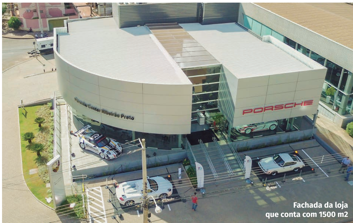
Fachada da loja que conta com 1500 m 2

“Ribeirão Preto é a uma cidade importante para Porsche em uma das regiões que mais se desenvolvem em economia e qualidade de vida no Brasil. Nosso foco é seguir na estratégia que começamos em 2016, quando inauguramos os Porsche Centers de Recife, Campinas e Florianópolis, além da renovação da unidade do Rio de Janeiro, esta já em 2017”, disse Werner Schaal, diretor de vendas da Porsche Brasil.